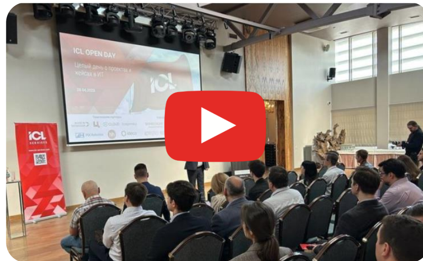
ICL OPEN DAY. Репортаж 2023 года