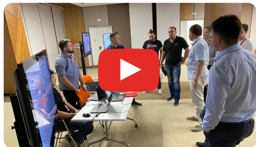
ICL OPEN DAY. Угрозы информационной безопасности. Как защитить бизнес?