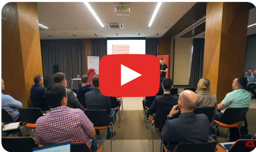
ICL OPEN DAY. Открываем двери новым возможностям для бизнеса!